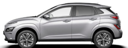
Shimmering Silver Metallic Kontrastdach verfügbar