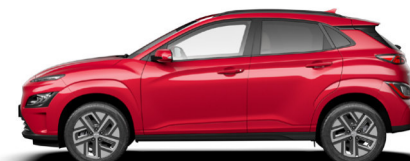
Sunset Red Pearl Kontrastdach verfügbar