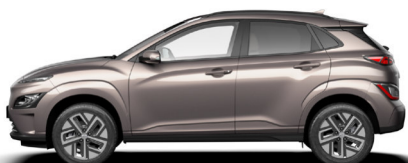
Silky Bronze Metallic Kontrastdach verfügbar