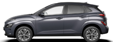
Dark Knight Gray Pearl Kontrastdach verfügbar