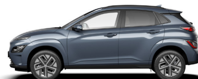
Dark Teal Metallic Kontrastdach verfügbar