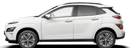
Serenity White Pearl Kontrastdach verfügbar