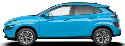
Dive Blue Kontrastdach verfügbar